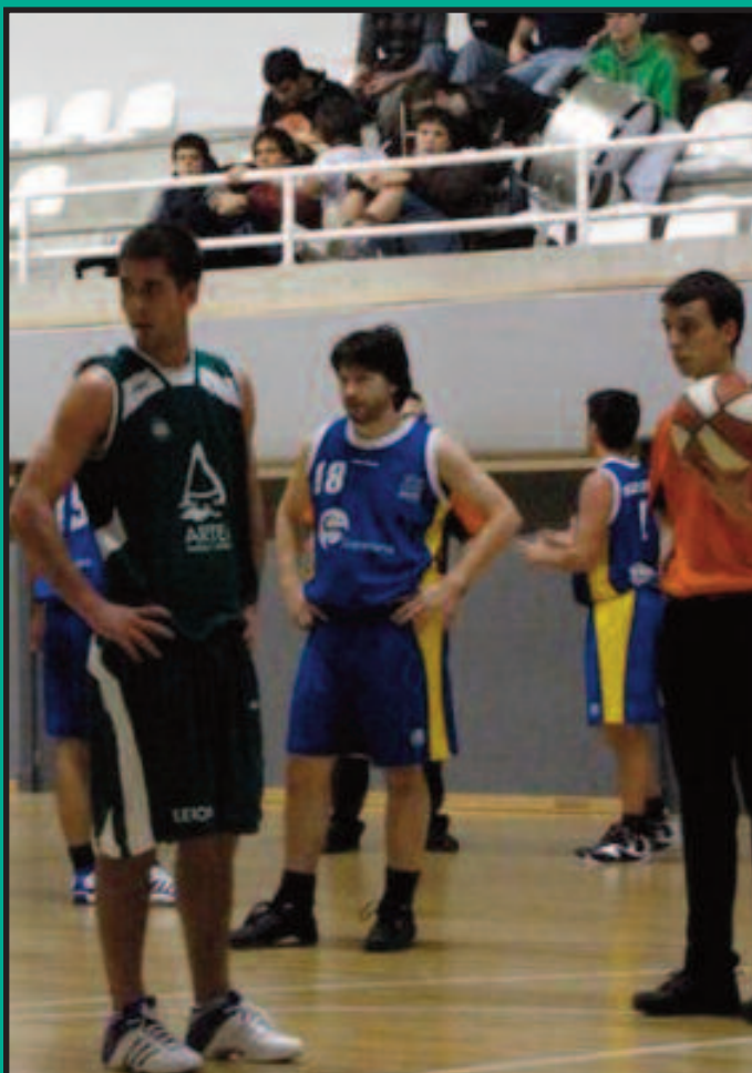
En un partido durante la pasada temporada

“Al principio me costó situarme, pero a partir del minuto dos comencé a disfrutar totalmente del partido”