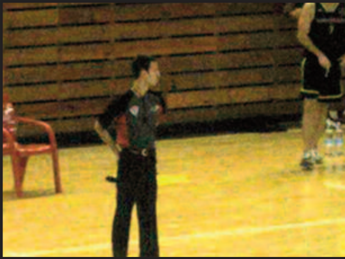
Con la equipación del Comité Vasco

“Tres palabras definieron mi impresión sobre el partido: me ha encantado.”