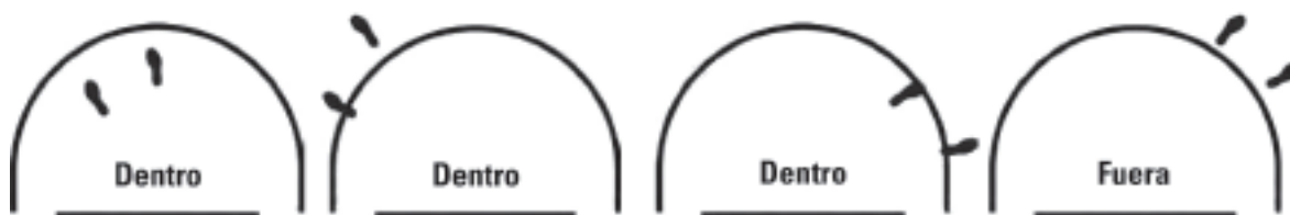
Diagrama 4 - Posición de un jugador dentro/fuera de la zona de semicírculo de no-carga

Interpretación: Jugada legal de A1. Se aplicará la regla del semicírculo de no-carga.