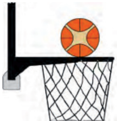
Diagrama 2 - Balón en contacto con el aro

31-15 Situación. Se produce una interferencia si un defensor o un atacante tocan la canasta o el tablero durante un lanzamiento a cesto mientras el balón está en contacto con el aro y aún tiene la posibilidad de entrar en el cesto.