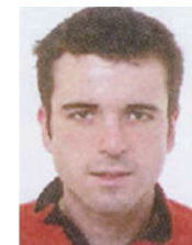
Mikel SEGURADO TECNOLOGIAS