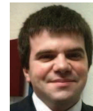
Carmelo GUTIERREZ COMUNICACION